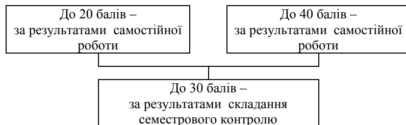
Рис. 2.1. Схема нарахування балів студентам за результатами навчання

2.2. Обсяг балів, здобутих студентом під час лекцій з навчальної дисципліни, обчислюється у пропорційному співвідношенні кількості відвіданих лекцій і кількості лекцій, передбачених навчальним планом, і визначається згідно з додатками 1 і 2 до Положення про організацію освітнього процесу в Хмельницькому університеті управління та права.